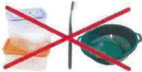
petits objets en plastique