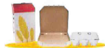
les petits emballages en carton