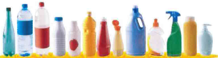
toutes les bouteilles en plastique