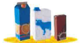
les briques alimentaires