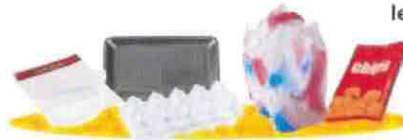
les barquettes en polystyrène et tous les films en plastique,

Aplatissez-les ! Déposez-les EN VRAC, pas en sac !