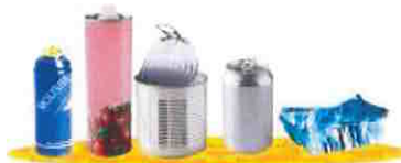
tous les aérosols, bouteilles, boîtes et tubes en métal